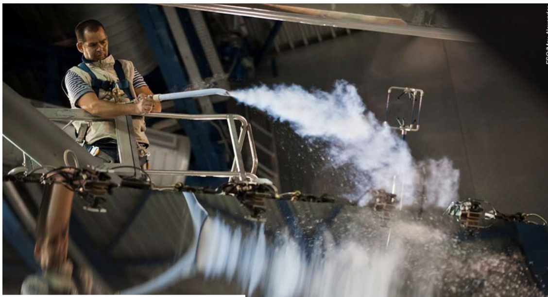
Cleaning mirrors with CO 2 .

Los Operadores de Telescopios e Instrumentos (TIOs) que estén destinados a tiempo completo en Turno Bisemanal 7/7, reciben un 35% de su sueldo base como bono adicional. El miembro del personal local destinado a menor tiempo, recibe una proporción equivalente correspondiente al número de turnos nocturnos realizados.