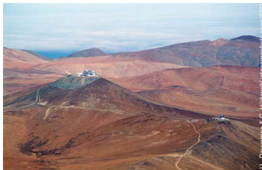
Vista Aérea del Observatorio Paranal.