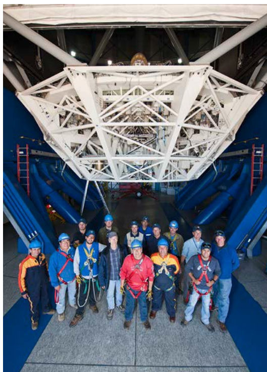
Fotografía grupal de ingenieros y staff de mantenimiento en el VLT.

Los Miembros del Personal Local designados como Coordinadores de Emergencia en los observatorios, en ausencia del Ingeniero de Seguridad, durante fines de semana o permisos, recibirán una compensación equivalente a las condiciones que se aplican al servicio de llamada.